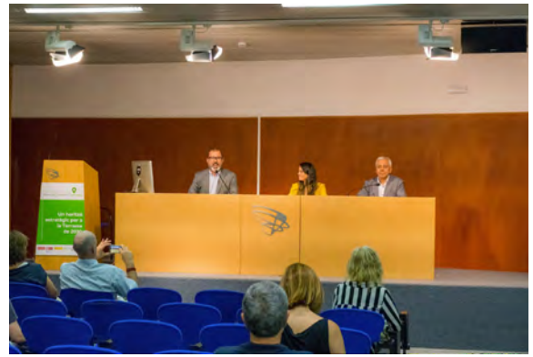
L'Agenda Urbana de Terrassa fa servir una metodologia comuna que és clau per planificar les ciutats del futur